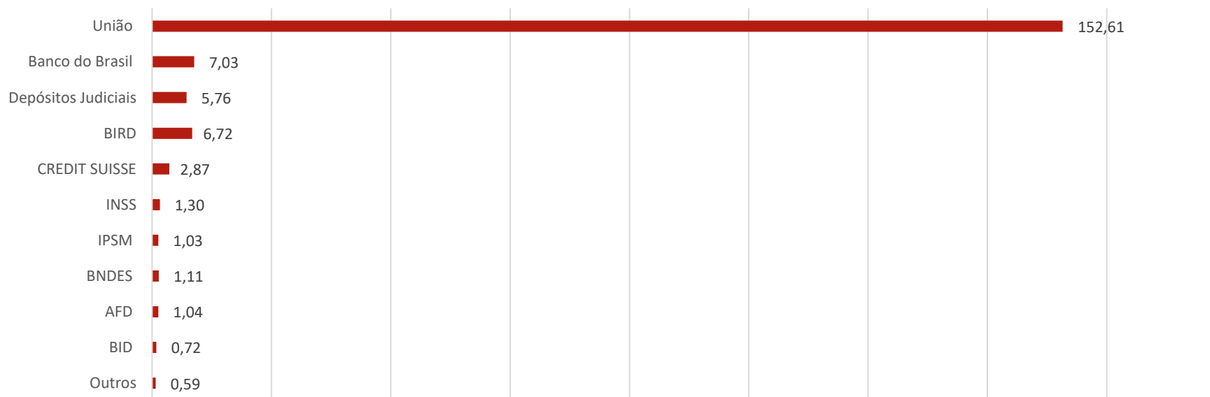
Estoque da dívida por credor

1- CAM – Coeficiente de Atualização Monetária aplicado aos contratos de refinanciamento de dívida com a União – Lei 9.496/1997; LC 178/2021 e LC 159/2017.