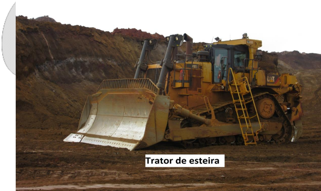
Trator de esteira

As fotografias infra reproduzidas identificam o trator de esteira, a borda e o canto do trator: