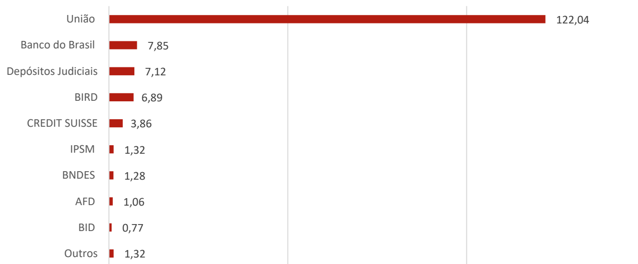
Estoque da dívida por credor

2- A redução nominal na dívida indexada ao câmbio é reflexo do refinanciamento das parcelas que se encontravam em aberto em função das liminares. Até a assinatura do contrato nº 283/2022/CAF em 30/06/2022 as parcelas inadimplidas estavam sendo contabilizadas nos saldos dos contratos de origem das obrigações.